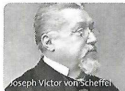
Joseph Victor von Scheffel