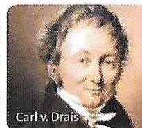
Carl v. Drais

Vereinigung zur Wahrung badischer Interessen und Verwirklichung einer freundschaftlichen Partnerschaft über die Grenzen