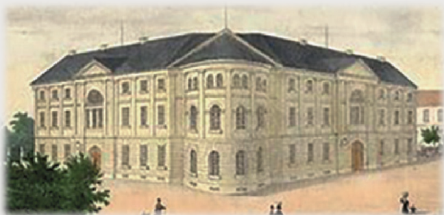
Parlamentsgebäude Karlsruhe 1822

Die staatsbürgerlichen und politischen Rechte der badischen Bürger waren die fortschrittlichsten der damaligen Zeit.